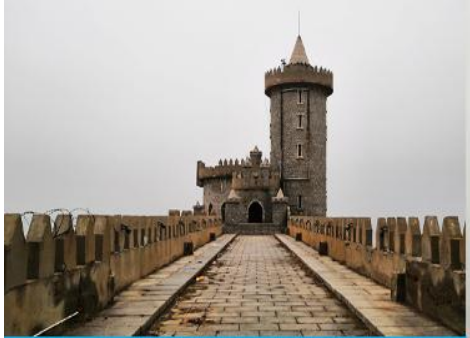
คาเฟ่อีสตง