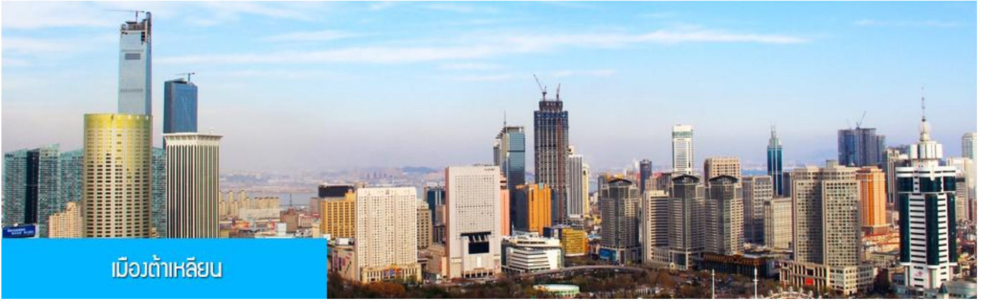
เมืองต้าเหลียน