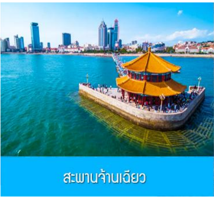
สะพานจ้านเจียว