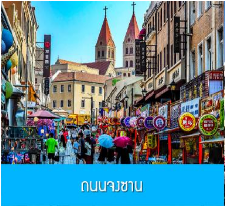
ถนนางซาน