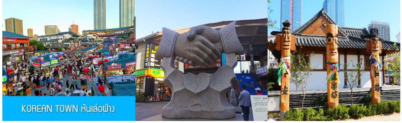
KOREAN TOWN หันล่อฟ้า