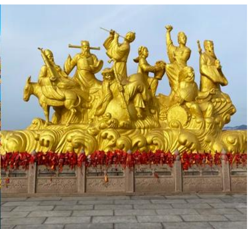
อุทยานท่องเที่ยวแปดเซียนข้ามทะเล