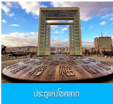
ประตูแห่งโชคกลาง