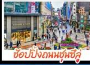
ซ็อบนึ่งกมบชุนซ็ู่