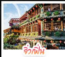
จิ่วเฟิน