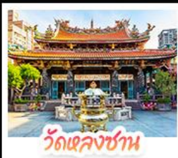
วัดเลกงชาน