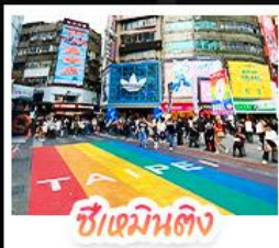
ซีเหมินตง