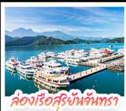
ล่องเรือสุริยันเจ็นทรา

รถไฟไต้หวัน จองเรือชมทะเลสาบสุริยันเจ็นทรา (SUN MOON LAKE) ชมเกาะลาลู แฉะ วัดสวนกง • อีสระดินเล่น หมู่บ้านอู๋ต้าเซ่า • มังกรไฟเล็กโบราณ (1 สถานี) สัมผัสบรรยากาศเส้นทางรถไฟสายธรรมชาติ • ตะลุย ไทจงโมเทอริ่งเกิด แหล่งรวมแฟชั่นและสตรีทฟู้ด • ช้อปปิ้งย่าน ซี่เหมินตง (XIMENDING) ถ่ายรูปแลนด์มาร์ค ดึกไทเป 101 • ช้อปปิ้งถึงทงทง MITSUI OUTLET PARK ชมความสวยงามของ อุทยานสแกนเจียงโตซึก • ทิวทัศน์ความรักที่ วัดหลงชาน ชมทัศนียภาพที่สวยงามที่ เย่หลิว • ชมบรรยากาศเมืองเก่าที่ จิวเฟิน