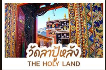
วัดลาปูหลง THE HOLY LAND

หนึ่งศรัทธา: สัมผัสความสงบและสถาปัตยกรรมทิเบตที่ วัดลาปูหลง หนึ่งผืนหญ้า: ล่องลอยไปในความเขียวจีงจอง กู่หญ้ากานหนาน หนึ่งสายน้ำ: ค้นพบความงามเหนือกาลเวลาที่ จิวจ้ายโกว