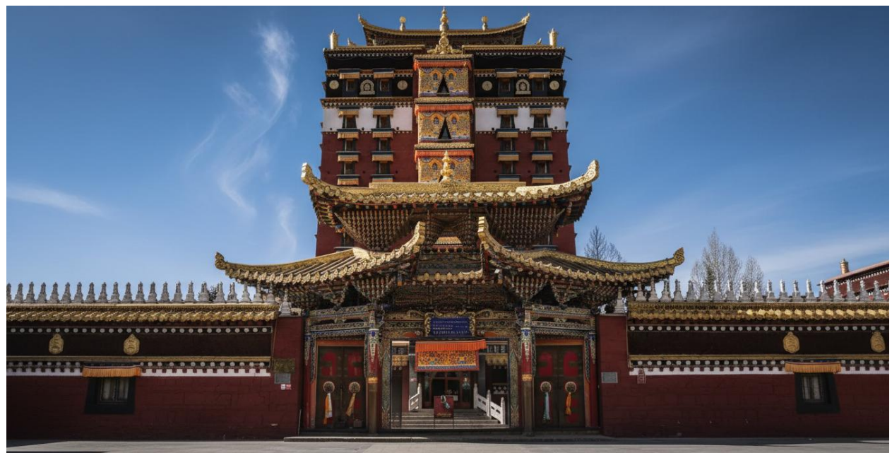
บ่าย นำท่านเดินทางสู่ หอพระมิลारेปะ (ระยะทาง 134 ก.ม. ใช้เวลาเดินทางประมาณ 2 ชั่วโมง) สู่ใจกลางศรัทธา หอพระ 9 ชั้น มิลारेปะ สถาปัตยกรรมทางพุทธศาสนาที่น่าอัศจรรย์และเป็นหนึ่งเดียวใน

2ULHW-MU001 THE ETERNAL GANNAN & JIUZHAO เสน่ห์ทิเบตแห่งศรัทธาและสายน้ำสีคราม 8 วัน 6 คืน โดย สายการบินไชน่า อีสเทิร์น (MU)