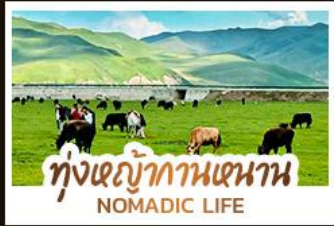
ทุ่งหญ้ากานหนาน NOMADIC LIFE