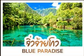
จิวจ้ายโกว BLUE PARADISE