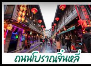
ถนนโบราณจั้นหลี่