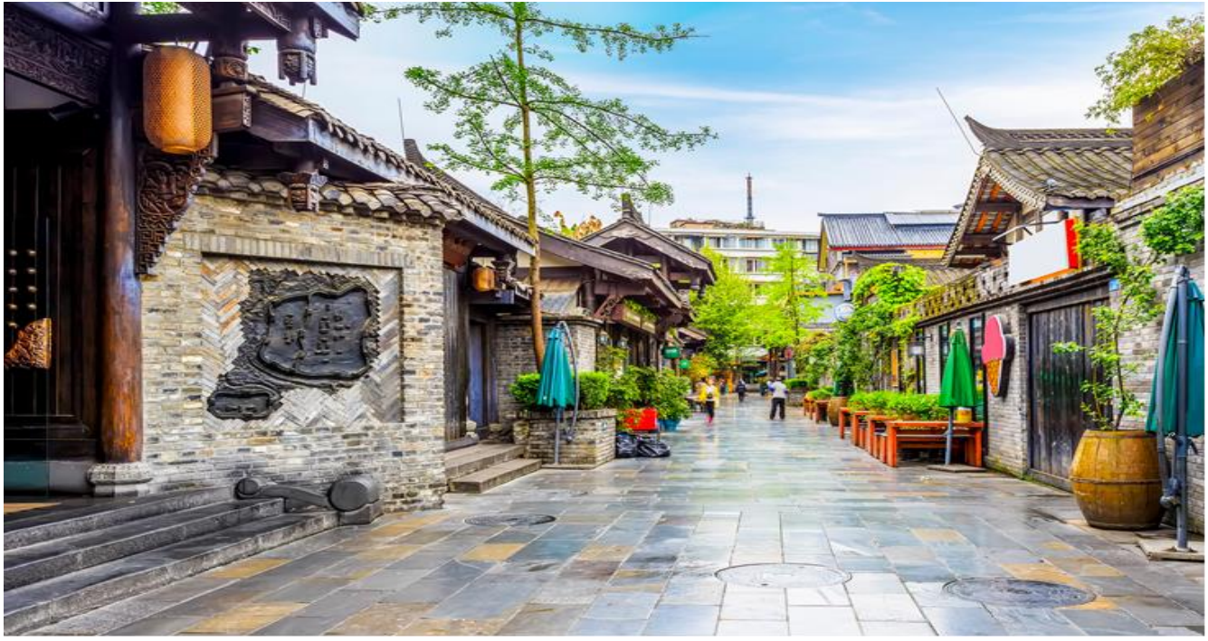
กลางวัน รับประทานอาหารกลางวัน ณ ภัตตาคาร (มือที่ 11)