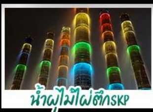
น้ำพุไม้ไฟตึกSKP