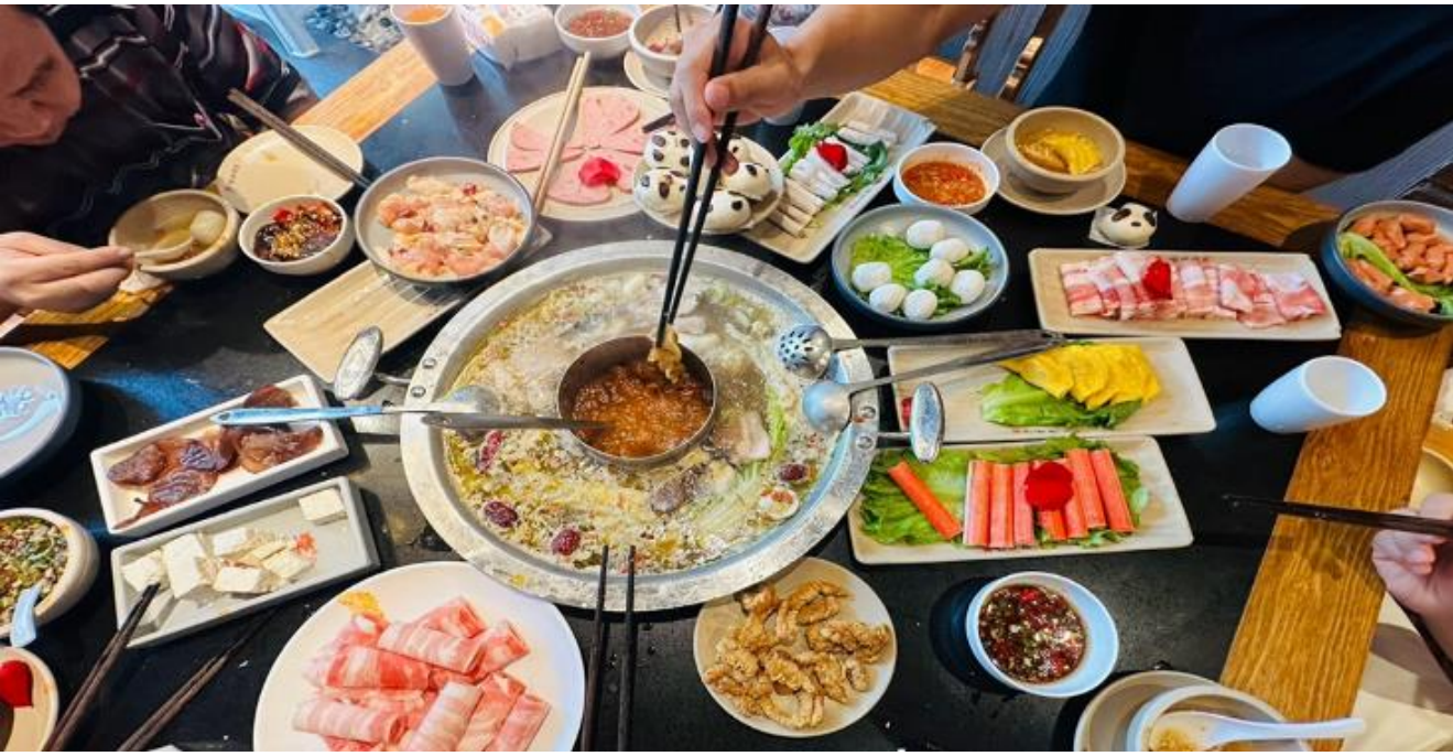
คำ รับประทานอาหารค่ำ ณ ภัตตาคาร (มือที่ 12) *เมนูพิเศษสุกี้หม่าล่าเสฉวน

อิสระช้อปปิ้ง ถนนไทกุหลี่ หนึ่งในแหล่งช้อปปิ้งและไลฟ์สไตล์ระดับพรีเมียม ตั้งอยู่ใจกลางเมืองเฉิงตูโดดเด่นด้วยการออกแบบสถาปัตยกรรมที่ผสมผสานระหว่างความโมเดิร์นและวัฒนธรรมจีนดั้งเดิม มีทั้งแบรนด์แฟชั่นระดับโลกอย่าง Gucci, Chanel, Balenciaga รวมถึงร้านค้าไลฟ์สไตล์และแฟชั่นท้องถิ่น อาหารท้องถิ่นและคาเฟ่นานาชาติสวยๆ ที่เหมาะสำหรับการนั่งพักผ่อน