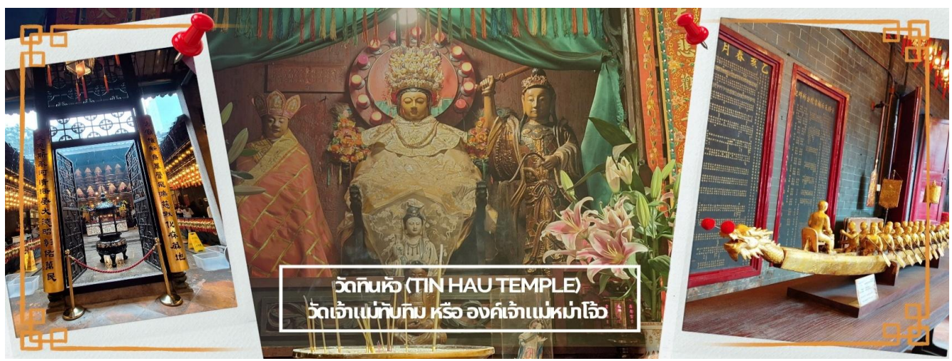
วัดทินฮั่ว (TIN HAU TEMPLE) วัดเจ้าแม่ทับทิม หรือ องค์เจ้าแม่มาโจ้ว

จากนั้นนำท่าน ไหว้ขอพรเรื่องเดินทาง การติดต่อ ค้าขาย วัดเจ้าแม่ทับทิมทินฮั่ว (Tin Hau Temple) ที่ Yau Ma Tei เป็นวัดเก่าแก่ขนาดเล็ก อายุกว่า 150 ปี มีต้นกำเนิดมาจากวัดเล็กๆ ใน พื้นที่ตลาด Kwun Chung เคยเป็นหมู่บ้านชาวประมงมาก่อน ตั้งแต่ปี 1864 เป็นวัดที่อุทิศให้กับทินฮั่ว (หมาใจ เทพเจ้าแห่งท้องทะเล) มีบรรยากาศที่สงบ ร่มรื่น ติดกับสวนสาธารณะเล็ก ๆ และนักท่องเที่ยวยังไม่พลุกพล่านมากจุดเด่นที่แนะนำคือ การปิดทองเรือมังกร เพื่อการงานการค้า ธุรกิจ ให้เจริญรุ่งเรือง