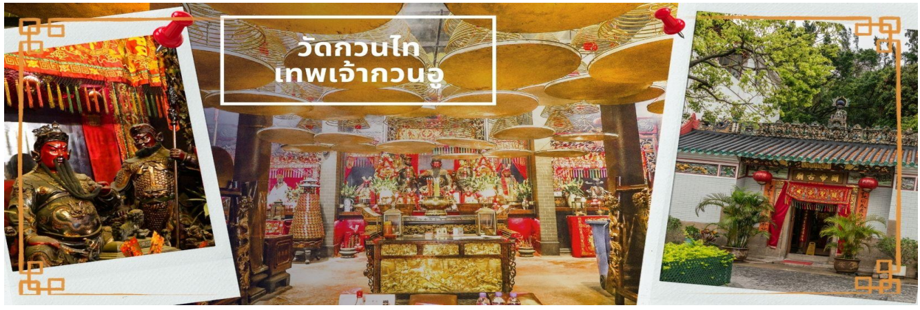
วัดกวนไท เทพเจ้ากวนอู

จากนั้นนำท่าน ไหว้ขอพรเรื่องเดินทาง การติดต่อ ค้าขาย วัดเจ้าแม่ทับทิมทินฮั่ว (Tin Hau Temple) ที่ Yau Ma Tei เป็นวัดเก่าแก่ขนาดเล็ก อายุกว่า 150 ปี มีต้นกำเนิดมาจากวัดเล็กๆ ใน พื้นที่ตลาด Kwun Chung เคยเป็นหมู่บ้านชาวประมงมาก่อน ตั้งแต่ปี 1864 เป็นวัดที่อุทิศให้กับทินฮั่ว (หมาใจ เทพเจ้าแห่งท้องทะเล) มีบรรยากาศที่สงบ ร่มรื่น ติดกับสวนสาธารณะเล็ก ๆ และนักท่องเที่ยวยังไม่พลุกพล่านมากจุดเด่นที่แนะนำคือ การปิดทองเรือมังกร เพื่อการงานการค้า ธุรกิจ ให้เจริญรุ่งเรือง