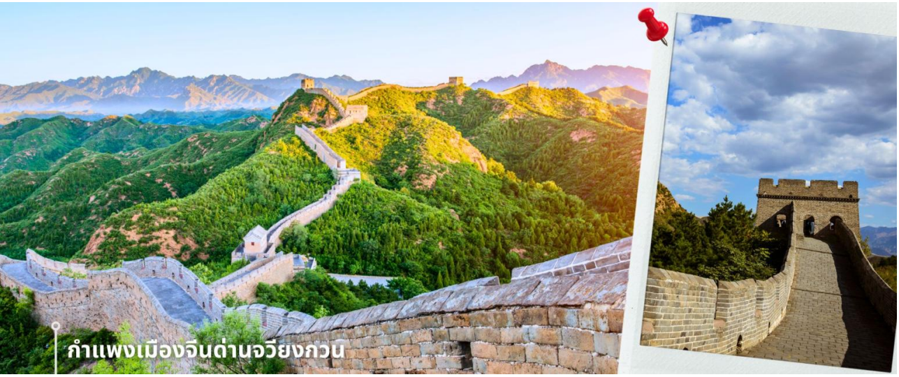
กำแพงเมืองจีนด้านจิวหยงกวน

กรุงปักกิ่งการรุกรานจากชนเผ่าเร่ร่อน ด้านจิวหยงกวนมีสถาปัตยกรรมที่สวยงามของศิลปะจีน จากยอดด่าน สามารถมองเห็นทิวทัศน์ที่สวยงามของเทือกเขาและธรรมชาติโดยรอบ นับว่าเป็น 1 ใน 8 จุดชมวิวที่มีชื่อเสียงของปักกิ่งมาตั้งแต่สมัยราชวงศ์ฉิน