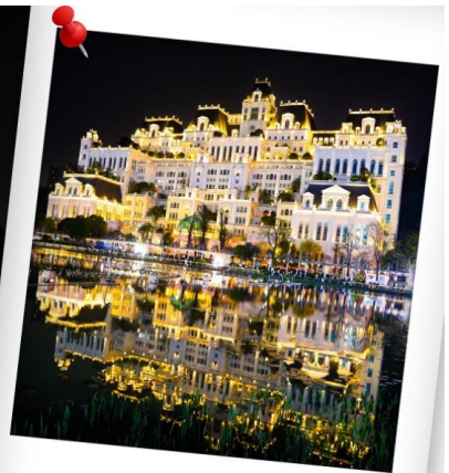
CAQKWE3 ก๊วยหยาง สะพานฮวาเจียง น้ำตกหวงกั๋วชู่ 5 วัน 4 คืน บิน 9AIR (JUN-DEC 26)