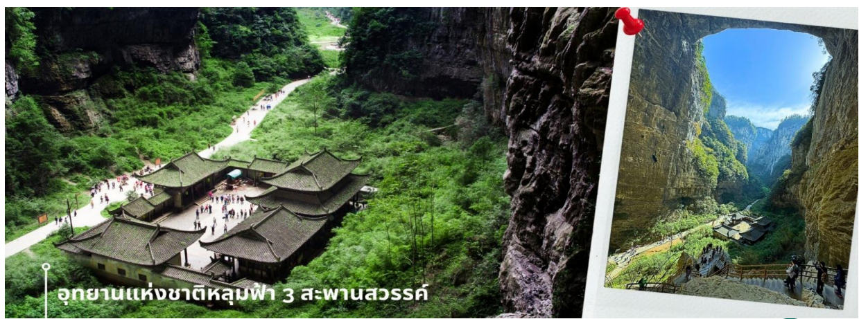
CEUTFU7 เมืองฉงชิ่ง อุทยานหลุมฟ้า ดำจู่ 6วัน 5คืน บิน CHENGDU AIRLINE (ไม่ลงร้าน) MAY-SEP 26

เที่ยง รับประทานอาหารกลางวัน ณ ภัตตาคาร (5) จากนั้นนำท่านเข้าชม อุทยานแห่งชาติหลุมฟ้า 3 สะพานสวรรค์ เป็นมรดกโลกทางธรรมชาติระดับ 5A ที่มีความสวยงามมากที่สุดแห่งหนึ่ง ตั้งอยู่ที่เมืองอู่หลง นครฉงชิ่ง ประเทศจีน เกิดจากการยุบตัวของเปลือกโลก ทำให้เกิดเป็นบ่อหลุมขนาดใหญ่ที่ลึกประมาณ 300-500 เมตร และมีบางส่วนเป็นโพรงทะลุเหมือนกับสะพานทอดข้าม