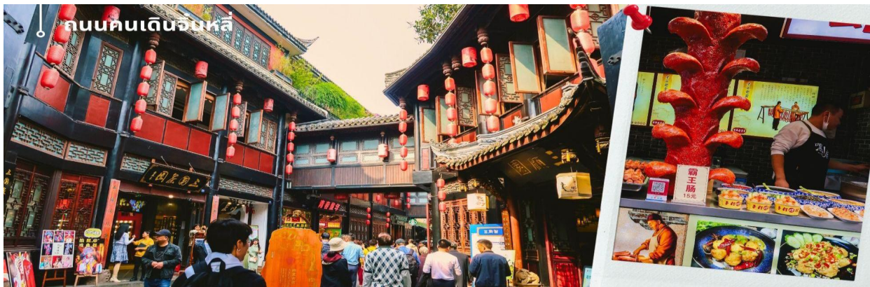
ถนนคนเดินจินหลี่

นำท่านเดินเล่น ถนนโบราณจินหลี่ เป็นหนึ่งในสถานที่ท่องเที่ยวที่น่าสนใจที่สุดสำหรับผู้ชื่นชอบประวัติศาสตร์และวัฒนธรรมจีน หมู่บ้านโบราณแห่งนี้มีความสำคัญอย่างยิ่งในเรื่องของประวัติศาสตร์ที่ยาวนานถึง 1,800 ปี ซึ่งเต็มไปด้วยวัฒนธรรมและขนบธรรมเนียมที่สะท้อนให้เห็นถึงวิถีชีวิตของคนจีนในยุคสมัยโบราณ จินหลี่เป็นหนึ่งในสถานที่ท่องเที่ยวที่นักท่องเที่ยวจากทั่วโลกให้ความสนใจอย่างมาก เนื่องจากการท่องเที่ยวที่นี่สามารถสัมผัสได้ถึงกลิ่นอายของประวัติศาสตร์ที่หลากหลาย