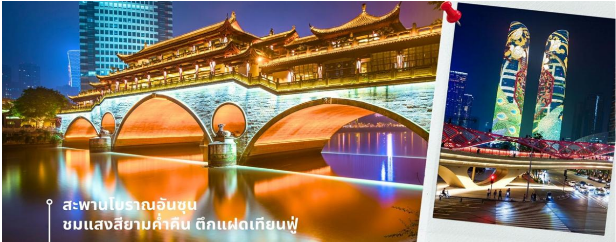
สะพานโบราณอันชวน ชมแสงสียามค่ำคืน ตึกแฝดเทียนฟู่

นำท่านชม สะพานโบราณอันชวน-พร้อมชมแสงสียามค่ำคืน ตึกแฝดเทียนฟู่ เป็นสะพานข้ามคลองที่สร้างเป็นเหมือนอาคารอยู่ข้างบน ในช่วงเวลายามเย็นจะเป็นช่วงที่ผู้คนออกมาชมบรรยากาศบริเวณของสะพานแห่งนี้ และมีร้านค้ามากมาย รวมไปถึงบาร์เครื่องดื่มต่างๆ ที่ดึงดูดนักท่องเที่ยวได้เป็นอย่างดี เป็นสะพานที่ทอดข้ามแม่น้ำจินเจียง และเป็นรูปแบบสะพานมีหลังคา ตามลักษณะสถาปัตยกรรมจีนโบราณ อายุมากกว่า 300 ปี และในบริเวณใกล้เคียงยังเป็นที่ตั้งของ ตึกแฝดเทียนฟู่ โดยในช่วงค่ำเวลา ประมาณ 19.00-22.00 น. ทั้ง 2 ตึกจะเป็นไฟ LED สวยงามโดดเด่นมาก ตึกแฝดเทียนฟู่ หรือที่เรียกอย่างเป็นทางการว่าตึกศูนย์การเงินนานาชาติเทียนฟู่ เป็นตึกระฟ้าที่สวยงามโดดเด่นสองตึกในย่านการเงินของเฉิงตู ตึกแต่ละตึกมีความสูง 58 ชั้นและสูงกว่า 700 ฟุต ตึกเหล่านี้โดดเด่นเป็นพิเศษด้วยภายนอกที่หุ้มด้วยไฟ LED ที่เป็นเอกลักษณ์ ซึ่งเปลี่ยนอาคารให้กลายเป็นจอภาพดิจิทัลขนาดใหญ่