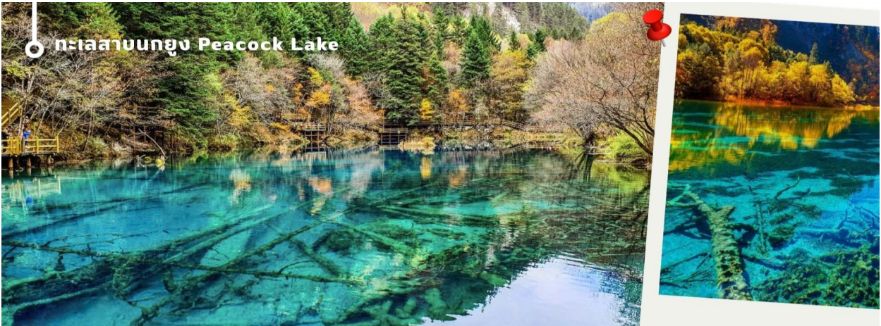
ทะเลสาบนกยูง Peacock Lake

ทะเลสาบมีรูปร่างคล้ายกับนกยูง จึงเป็นที่มาของชื่อ แม้พื้นที่จะไม่กว้างมากนัก มีความยาวเพียงแค่ 310 เมตร แต่ความสวยงามของที่นี่ก็ไม่ว่าคู่กันของอุทยานฯ เพราะน้ำในทะเลสาบเป็นสีฟ้าใสราวกับคริสตัล ไล่เฉดฟ้าอ่อนฟ้าอมเขียว และน้ำเงินตามความตื้นลึกของน้ำ ในช่วงฤดูหนาวต้นไม้จะถูกปกคลุมไปด้วยหิมะสีขาวนวล ดูแล้วคล้ายนกยูงกำลังจ้ำจี้ หากมาในช่วงที่มีแสงแดดจะมองเห็นความงดงามได้ทั่วบริเวณ