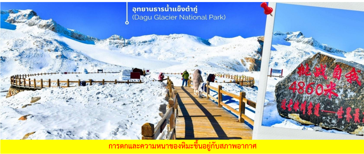
การตกและความหนาวของหิมะขึ้นอยู่กับสภาพอากาศ

เช้า ต้อนรับทานเช้า ณ ห้องอาหารของโรงแรม (4) จากนั้นนำท่านเดินทางสู่ เมืองเฮยสุ่ย (ใช้เวลาเดินทางประมาณ 2.5 ชั่วโมง) เพื่อเดินทางไปยัง อุทยานธารน้ำแข็งต้ากู่ปิงชว่น(รวมกระเช้าขึ้นลง) ต้ากู่ปิงชว่น หรือ Dagu Glacier National Park เป็นธารน้ำแข็งกลางเขี้ยวที่สวยงามที่สุดแห่งหนึ่งของโลก และเป็นสถานที่ท่องเที่ยวระดับ 4A ของจีน ตั้งอยู่ที่เมืองเฮยสุ่ย ในมณฑลเสฉวน ห่างจากเมืองเฉิงตูประมาณ 300 กิโลเมตร ถือเป็นธารน้ำแข็งที่อายุน้อยที่สุด ที่ตั้งอยู่ในระดับความสูงที่ต่ำที่สุด และอยู่ใกล้กับเมืองมากที่สุดในบรรดาธารน้ำแข็งทั้งหมด โดยอยู่สูงจากระดับน้ำทะเลประมาณ 3,800-5,100 เมตร จุดสูงที่สุดที่นักท่องเที่ยวสามารถขึ้นไปได้จะอยู่ที่ 4,860 เมตร