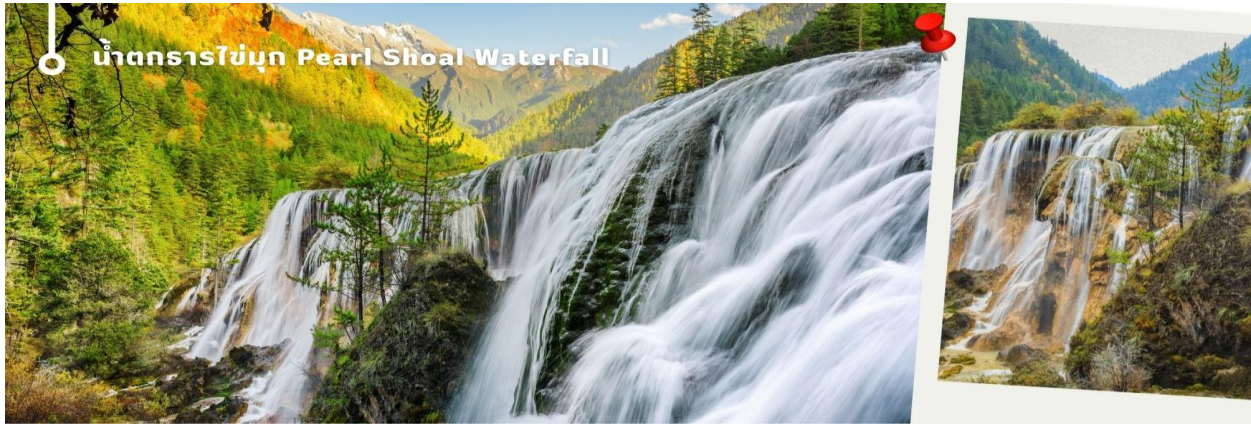
น้ำตกธารไข่มุก Pearl Shoal Waterfall

3.น้ำตกธารไข่มุก (Pearl Shoal Waterfall) หรือ น้ำตกนุริออลาง (Nuo Ri Lang Waterfall) ถือเป็นน้ำตกที่ใหญ่ที่สุดในจิวจ้ายโกว มีความสูง 40 เมตร กว้าง 310 เมตร เกิดจากหินปูนที่แข็งตัวจนกลายเป็นรูปทรงคล้ายพัด มีสายธารน้อยใหญ่ไหลผ่านลดหลั่นทอดยาวผ่านชั้นหินต่างๆ ยามมีแสงแดดสาดส่องตกลงกระทบผิวน้ำจะส่องประกายราวกับเส้นไข่มุกเหมือนชื่อน้ำตก บางครั้งอาจได้เห็นสายรุ้งจากแสงแดดที่สะท้อนกับละอองน้ำอีกด้วย หากได้มาในช่วงฤดูหนาว ก็จะได้เห็นหิมะเกาะตามต้นไม้ โขดหิน และถ้าอากาศหนาวมากๆ น้ำที่น้ำตกก็จะกลายเป็นน้ำแข็ง กลายเป็นประติมากรรมจากธรรมชาติที่สวยงาม