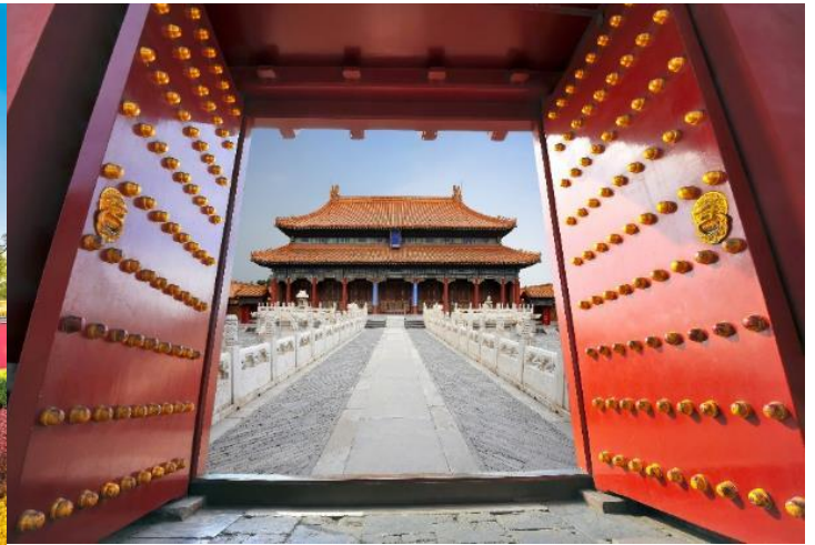
ตั้งอยู่ท่ามกลางสวนที่สวยงาม เต็มไปด้วยต้นไม้ ดอกไม้

**ในกรณีที่พระราชวังต้องห้ามกุ๊กง ไม่สามารถเข้าได้ จำนวนผู้เข้าชมมากเกินกำหนดต่อวัน หรือโดนสั่งปิดจากทางรัฐบาล กภัยพิบัติทางธรรมชาติ และในกรณีอื่นใดก็ตาม ทั้งนี้ ทางบริษัทฯ ขอสงวนสิทธิ์ปรับเป็น ชมพระราชวังองค์ชายน้อย โดยคำนึงถึงความปลอดภัยของท่านเป็นหลัก แทนโดยไม่แจ้งให้ทราบล่วงหน้า ทุกกรณี