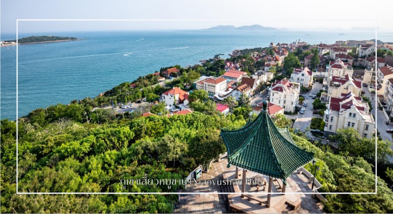
ภูเขาเสี่ยวหยูซาน (Xiaoyushan Hill)

นำท่านสู่ ภูเขาเสี่ยวหยูซาน (Xiaoyushan Hill) เนินเขาขนาดเล็กที่ตั้งอยู่ใจกลางเมืองชิงเต่า หนึ่งในจุดชมวิวที่งดงามที่สุดของเมือง จากยอดเขาท่านจะได้สัมผัสทัศนียภาพแบบพาโนรามาของชายฝั่งทะเล อาคารบ้านเรือนสไตล์ยุโรปหลังคาสีส้ม โบสถ์เซนต์ไมเคิล และสะพานเจียวเซี่ยวอันโด่งดัง ท่ามกลางอากาศบริสุทธิ์และสายลมทะเลพัดผ่าน