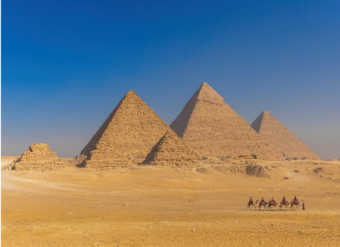
แนะนำโปรแกรมเสริมพิเศษ ไม่รวมอยู่ในราคาทัวร์ (OPTIONAL TOUR)

- สำหรับท่านใดที่สนใจขี่อูฐกลางทะเลทราย พร้อมชมความงดงามของพีระมิด ทั้ง 3 แห่งที่ตั้งตระหง่านเป็นฉากหลัง (1 ท่านต่ออูฐ 1 ตัว ใช้เวลาประมาณ 30 นาที) (ค่าใช้จ่ายในการขี่อูฐ ประมาณท่านละ 30 เหรียญดอลลาร์สหรัฐ (USD))