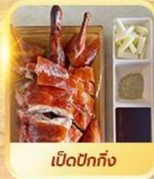
เปิดปีกทั้ง