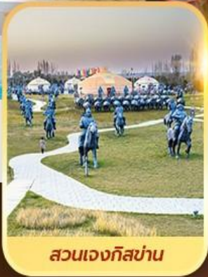
สวนเจงกิสข่าน