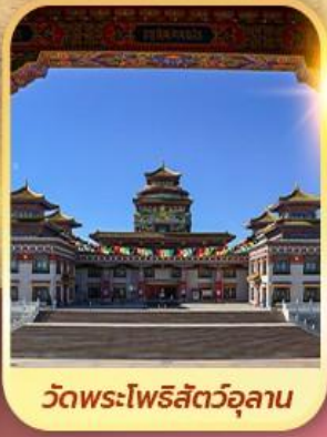
วัดพระโพธิสัตว์อูลาน