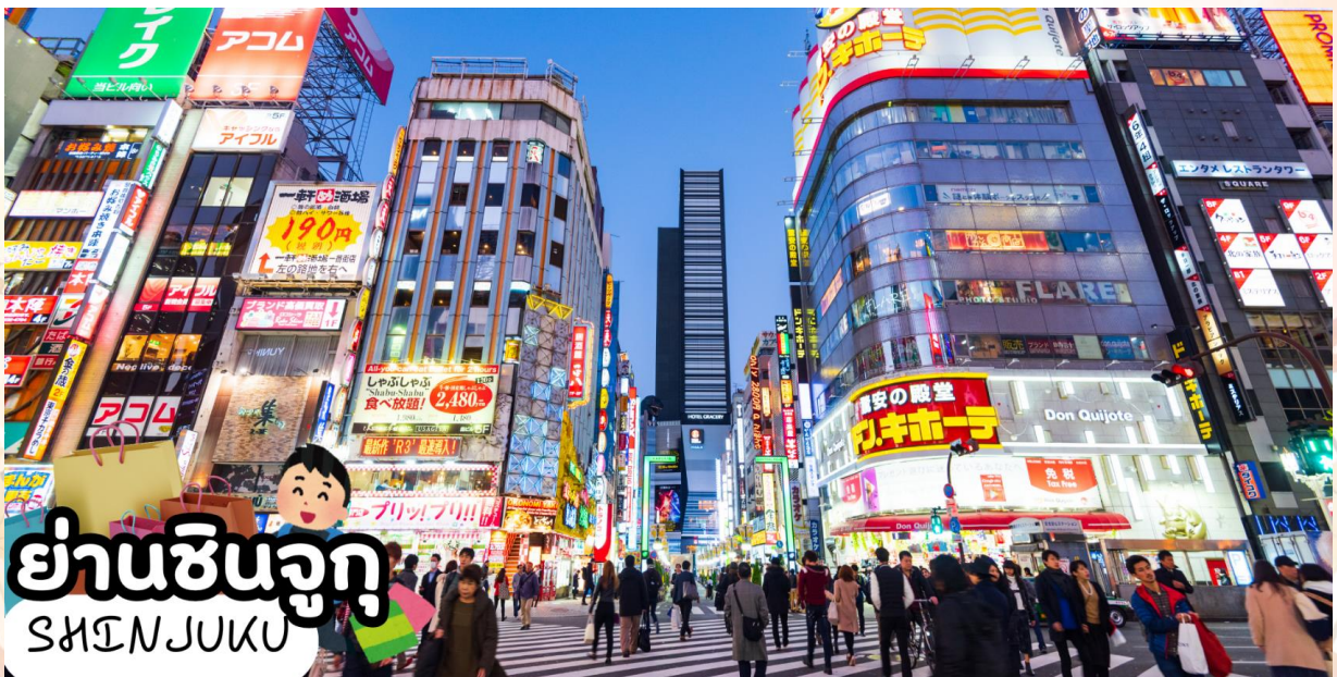
GO2NRT-TG100- TOKYO FUJI NIKKO MOMIJI AUTUMN 6D 4N

ข้อปิ้งใจกลางมหานครโตเกียวอันเลื่องชื่ออย่าง ย่านชินจูกุ (Shinjuku) แหล่งบันเทิงและแหล่งช้อปปิ้งขนาดใหญ่ใจกลางเมืองหลวงโตเกียว เป็นศูนย์รวมแฟชั่นเก๋ ๆ เท่ห์ ๆ ของเหล่าบรรดาแฟชั่นนิสต้า มีสถานีรถไฟชินจูกุที่เป็นเหมือนศูนย์กลางของย่านนี้ ซึ่งเป็นหนึ่งในสถานที่ที่คึกคักที่สุดในญี่ปุ่น ในแต่ละวันมีผู้คนจำนวนมากถึง 2.5 ล้านคนที่ใช้บริการสถานีแห่งนี้ ทางด้านตะวันตกย่านนี้ที่เต็มไปด้วยตึกระฟ้าหลายอาคาร มีทั้งโรงแรมชั้นนำ และในสวนทางด้านตะวันออกนั้นคือ คาบูกิจิ (Kabuki-jo) เป็นย่านที่เต็มไปด้วยห้างสรรพสินค้า, ร้านเครื่องใช้ไฟฟ้าขนาดใหญ่อย่าง Bic Camera และย่านบันเทิงยามราตรีที่มีร้านอาหารเยอะแยะมากมาย เช่น ร้านอิซากายะ (Izakaya)