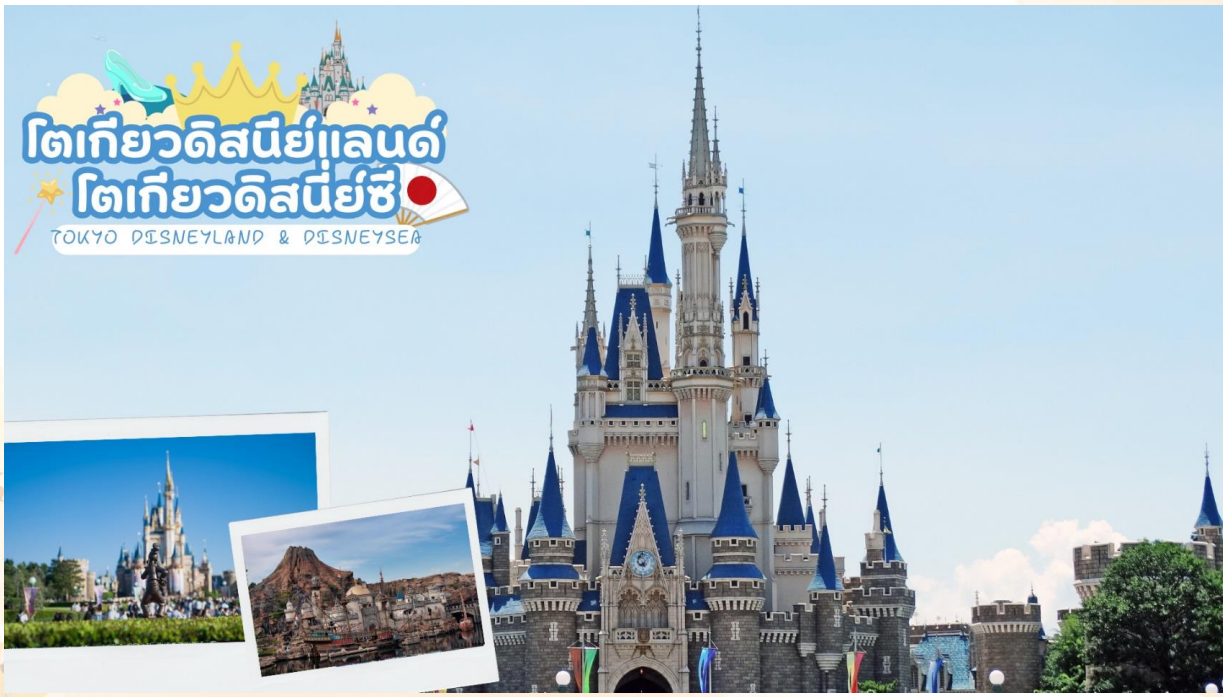
GO2NRT-TG100- TOKYO FUJI NIKKO MOMIJI AUTUMN 6D 4N

ย่านชิบูย่า (Shibuya) เต็มไปด้วยแหล่งช้อปปิ้ง ร้านอาหารที่ทันสมัย คลับ และอื่น ๆ อีกมากมาย นอกจากนั้นยังมีสถานที่ต่าง ๆ ที่คนต่างชาติรู้จักเป็นอย่างดี อาทิ รูปปั้นฮาจิโกะ ศูนย์ผู้ซื้อสัตย์ที่กลายเป็นจุดนัดพบและสถานที่ที่หากใครมาเยือนชิบูย่าต้องแวะมาถ่ายรูป ห้าแยกชิบูย่าที่มีคนเดินสวนกันไปมาจนตาสายบริเวณ ชิบูย่าเซ็นเตอร์ไก (Shibuya Center-gai) ถนนช้อปปิ้งแหล่งรวมตัวของวัยรุ่น อากิฮาบาระ (Akihabara) เป็นแหล่งช้อปปิ้งสุดคึกคักที่ขึ้นชื่อเรื่องร้านขายเครื่องใช้ไฟฟ้า ที่มีตั้งแต่ร้านเล็ก ๆ ไปจนถึงศูนย์การค้าขนาดใหญ่ เช่น ห้างโยโดบาชิ มัลติมีเดีย อากิบะ นอกจากนี้ยังมีร้านที่เน้นขายหนังสือการ์ตูนญี่ปุ่น แอนิเมชัน และวิดีโอเกมอย่างร้าน Tokyo Anime Center ซึ่งมีทั้งส่วนนิทรรศการและส่วนขายของที่ระลึก รวมถึงร้าน Radio Kaikan สูง 10 ชั้น ที่เต็มไปด้วยของเล่น เกมการ์ด และของสะสม ใกล้เคียงกันยังมีคาเฟ่ที่พนักงานในร้านสวมชุดเมดและพอบ้านอีกด้วย