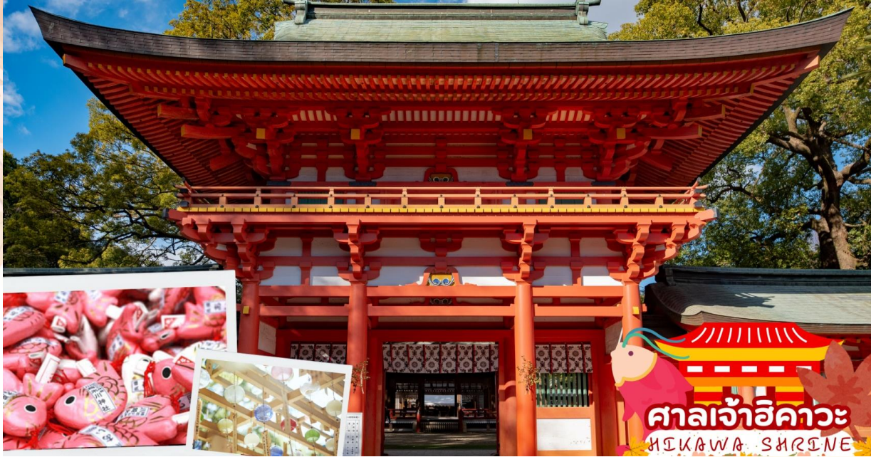
ศาลเจ้าฮิคาวะ HIKAWA SHRINE

ค่ำ รับประทานอาหารค่ำ ณ ห้องอาหารของโรงแรม (มื้อที่ 5)