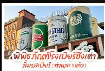
พิพิธภัณฑ์โรงเบียร์ชิงเต่า คิมรสเบียร์ (ท่านละ 1 แก้ว)