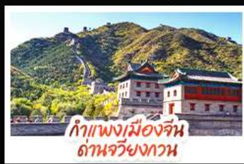
กำแพงเมืองจีน ด้านจวิ้นกวน

ล่องเรือสุดโรแมนติกแม่น้ำหวงผู้ ปักกิ่ง..เปิดประตูสู่แคมป์กร ด้วยความอลังการระดับจักรพรรดิ ชิงเต่า..เมืองชายทะเลสไตล์ยุโรป หรรษาแบบผ่อนคลาย เซี่ยงไฮ้..มหานครแห่งเอเชีย เมืองที่ไม่เคยหลับใหล