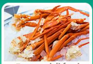
พิเศษ! บุฟเฟ่ต์งาปู