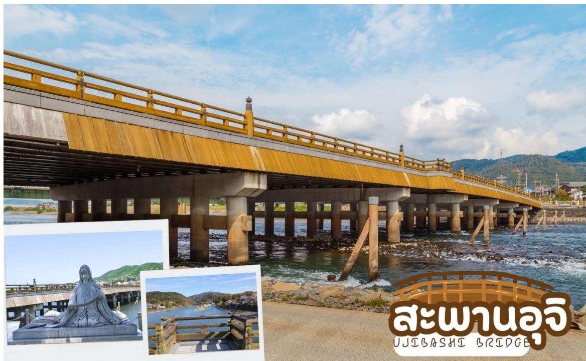
สะพานอุจิ UJIBASHI BRIDGE

สะพานอุจิ (Ujibashi Bridge) ซึ่งเป็นหนึ่งในสามสะพานที่เก่าแก่ที่สุดของญี่ปุ่น สร้างขึ้นในปี ค.ศ. 646 อายุประมาณ 1,370 ปี และเป็นมรดกทางประวัติศาสตร์ของชาวเมืองอุจิ สะพานอุจิเชื่อมตอสองฝั่งของแม่น้ำอุจิทัศนียภาพรอบ ๆ สวยงามตลอดปี โดยเฉพาะในช่วงใบไม้เปลี่ยนสีและฤดูซากุระที่สะพานแห่งนี้จะเต็มไปด้วยสีสันจากธรรมชาติ นอกจากนี้ บริเวณใกล้สะพานยังมีรูปปั้นของ มุราซากิ ชิคิบุ (Murasaki Shikibu) นักเขียนชาวญี่ปุ่นในยุคเฮอัน ผู้ประพันธ์ “ตำนานเก็นจิ” (The Tale of Genji) หนึ่งในนิยายเก่าแก่ตั้งแต่สมัยเฮอันและมีชื่อเสียงที่สุดของญี่ปุ่นโดยมีฉากหลังเป็นเมืองอุจิ