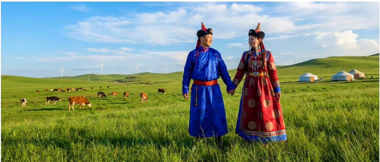
บ่าย นำท่านเข้าร่วมกิจกรรม สวมชุดแบบมองไกล สัมผัสพลังแห่งบรรพบุรุษ สวมเสื้อคลุมแบบดั้งเดิมที่มีสีสันสดใส ปักลวดลายอันประณีต คุณจะสัมผัสได้ถึงพลังแห่งบรรพบุรุษที่เคยปกครองดินแดนครึ่งโลก การสวม

2UDSN-VZ002 ลูกคุณหนู บินตรงแอร์คอส มองไกลเลียโน ตะลุยกทุ่งหญ้า ซิลล์ทะเลทราย พักสบายห้าดาว 6 วัน 5 คืน โดย ไทย เวียดนาม