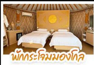
พักกระท่อมมองโกล