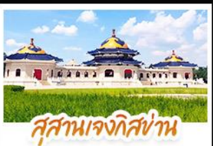
สุสานเจกิสถาน