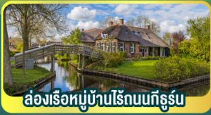
ล่องเรือหมู่บ้านไรกันนทึร์น