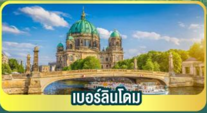
เบอร์ลินโดม