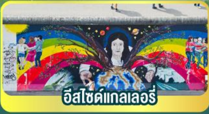
อิสซิดเทลเลอร์