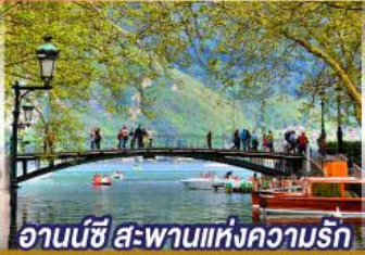
อานน์ซี สะพานแห่งความรัก