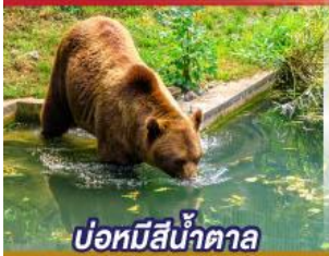
บ่อหมีสีน้ำตาล