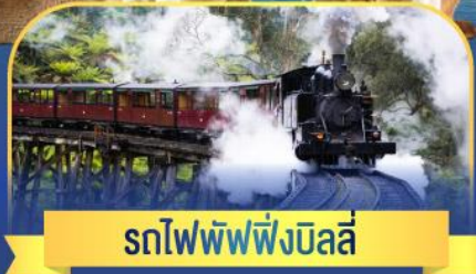
รถไพพพ์ฟิงบิลลี่

ล่องเรือชมอ่าวซิดนีย์พร้อมรับประทานอาหารกลางวัน และ เข้าชมสวนสัตว์การองก้า • ล่องเรือชมอ่าวซิดนีย์ • ชมโรงอุปรากรซิดนีย์ • เดินชมย่านเดอะ-ริจคส์ • ดินเนอร์ Half Lobster • บินเที่ยวบินภายในจากซิดนีย์สู่เมลเบิร์น • ชมขบวนพาเหรดนกเพนกวิน • นั่งรถไฟหัวรถจักรไอน้ำ Puffing Billy • ช้อปปิ้งจุใจในนครเมลเบิร์น