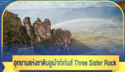
อุทยานแห่งชาติดูเน็กเกอร์ Three Sister Rock