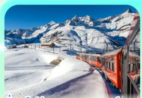
นั่งรถไฟสู่ยอดเขารอนเนอ์เกรต

สวยสะท้านฟ้าที่สวิสฯ สะกิดรักที่โดมโบ พิชิตเขาแมททอร์ฮอร์นและจุงเฟรา