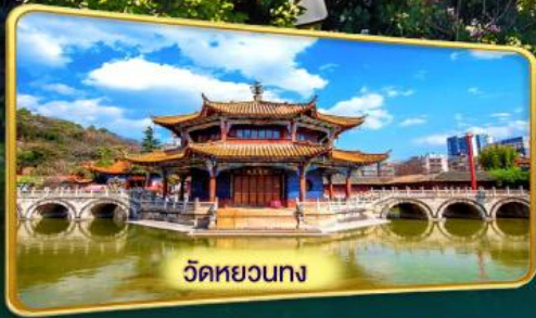
วัดหยวงทาง