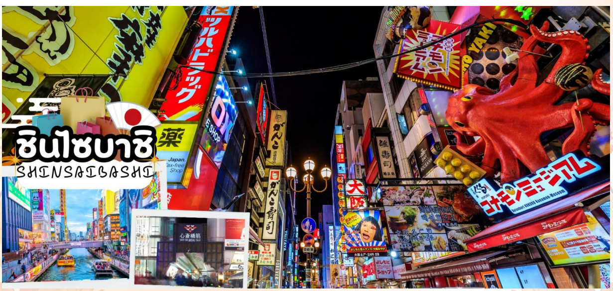
GO2HND-TG055 – FUJI KOCHIA TOKYO OSAKA 6D 4N BY [TG]

ย่านชินไซบาชิ เต็มไปด้วยความหลากหลายของร้านค้าและแบรนด์ดังมากมายตั้งอยู่ปะปนไปกับร้านค้าแบบดั้งเดิมของญี่ปุ่น ได้แก่ Apple Store, Dior, Chanel, Gucci, H&M, Hermès, Louis Vuitton และอื่น ๆ เรียกได้ว่าเป็นศูนย์รวมแทบจะทุกยี่ห้อดังทั่วโลกเลยก็ว่าได้ นอกจากนี้แล้วยังมีสินค้าจำพวกอาหารและเครื่องสำอางหรือตุ๊กตาน่ารัก ๆ ก็มีให้เลือกซื้อเช่นกัน และนอกเหนือไปจากร้านค้าทันสมัยจากแบรนด์ต่าง ๆ แล้วที่ชินไซบาชิยังมี Shopping Arcade ที่เอาร้านค้าเล็ก ๆ มารวมไว้ภายใต้หลังคาเดียวกันมีเส้นทางยาวประมาณ 600 เมตรมีสินค้าให้เลือกสรรมากมาย อาทิ ชุดกีโมนแบบดั้งเดิม, อัญมณีเครื่องประดับและร้านหนังสือ เป็นแหล่งที่ตั้งของห้างสรรพสินค้าชื่อดังและร้านค้ามากมายให้ท่านได้ช้อปปิ้งได้จุใจ