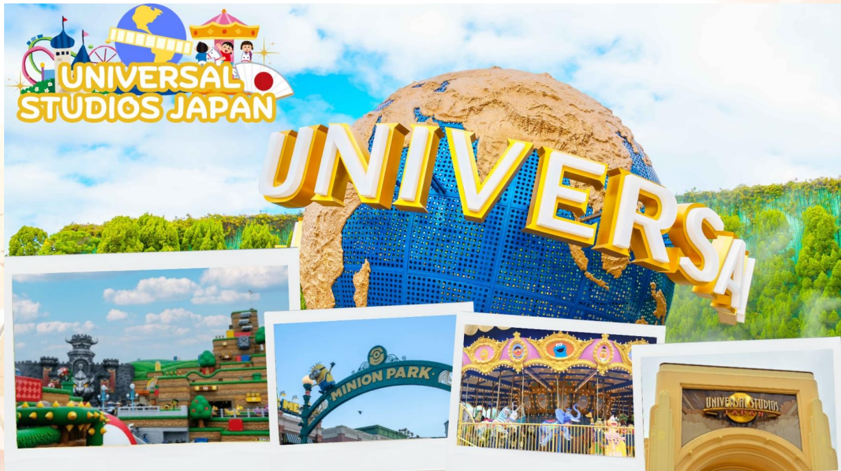
GO2HND-TG055 – FUJI KOCHIA TOKYO OSAKA 6D 4N BY [TG]