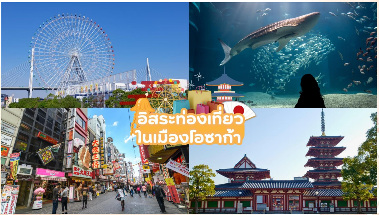
GO2HND-TG055 – FUJI KOCHIA TOKYO OSAKA 6D 4N BY [TG]

ให้ท่านได้เลือก อิสระท่องเที่ยวตามสถานที่ต่าง ๆ ใน เมืองโอซาก้า โดยมีไกด์คอยให้คำแนะนำท่านในการเดินทาง ย่านชินไซบาชิ เต็มไปด้วยความหลากหลายของร้านค้าและแบรนด์ดังมากมายตั้งอยู่ปะปนไปกับร้านค้าแบบดั้งเดิมของญี่ปุ่น ได้แก่ Apple Store, Dior, Chanel, Gucci, H&M, Hermès, Louis Vuitton และอื่น ๆ เรียกได้ว่าเป็นศูนย์รวมแทบจะทุกอย่างที่หือดังทั่วโลกเลยก็ว่าได้ นอกจากนี้แล้วยังมีสินค้าจำพวกอาหารและเครื่องดื่มหรือตุ๊กตาน่ารัก ๆ ก็มีให้เลือกซื้อเช่นกัน และนอกเหนือไปจากร้านค้าทันสมัยจากแบรนด์ต่าง ๆ แล้วที่ชินไซบาชิยังมี Shopping Arcade ที่เอาร้านค้าเล็ก ๆ มารวมไว้ภายใต้หลังคาเดียวกันมีเส้นทางยาวประมาณ 600 เมตร มีสินค้าให้เลือกสรรมากมาย อาทิ ชุดกิโมโนแบบดั้งเดิม, อนุรักษ์ณ์เครื่องประดับและร้านหนังสือ เป็นแหล่งที่ตั้งของห้างสรรพสินค้าชื่อดังและร้านค้ามากมายให้ท่านได้ช้อปปิ้งได้จุใจ และยังมีสถานที่ท่องเที่ยวสำคัญ ๆ ต่าง ๆ มากมาย เช่น วัดชิเทนโนจิ พิพิธภัณฑ์สัตว์น้ำไคยูกัง, ศาลเจ้าเฮอัน, ชิงช้าสวรรค์เท็มโปซาน, อะเมะริคามูระ, เลโกแลนด์, หุ่นยนต์เหล็กเท็ตสึจิน, พิพิธภัณฑ์วิทยาศาสตร์โอซาก้า