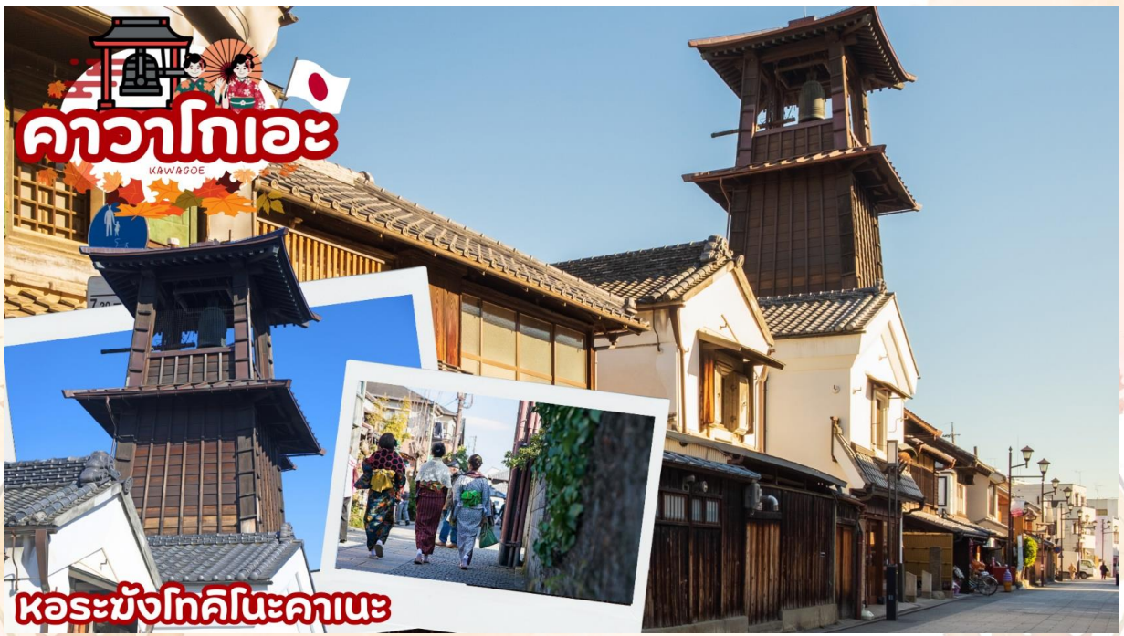
GO2HND-TG054 -- TOKYO OSAKA KAMIKOCHI HAKUBA 7D 5N BY [TG]

เดินทางสู่ คาวาโกเอะ (Kawagoe) ได้รับการขนานนามว่าเป็นลิตเติลเอโดะ เพราะมีบรรยากาศที่มีความเป็นเมืองเก่าที่ได้กลิ่นอายโบราณทำให้รู้สึกเหมือนได้ย้อนยุค ได้สัมผัสบรรยากาศของโกดังเก่า ที่เรียงรายกันยาวตลอดระยะทางกว่า 700 เมตร ในสมัยก่อนเป็นสถานที่เก็บกักเสบียงอาหารเพื่อส่งไปให้เมืองเอโดะ (โตเกียวในปัจจุบัน) แต่ในปัจจุบันได้ถูกเปลี่ยนเป็นร้านค้า ร้านอาหาร ร้านขายของที่ระลึก ไม่ว่าจะเป็นร้านขนมที่ทำจากมันหวานสีเหลืองและสีม่วงอันเป็นผลิตภัณฑ์ขึ้นชื่อของเมืองนี้ สถานที่ท่องเที่ยวอันมีชื่อเสียงของเมืองคาวาโกเอะ