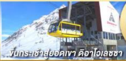
ขึ้นกระเช้าสูยอดเขา ดือาไวเลซซา