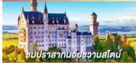
ชมปราสาทนอยชวานสไตน์