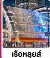
วัดดวงหยวน วัดพระหยกขาว หมู่บ้านโบราณจูเจียเจี๋ย อุโมงค์เลเซอร์ เรือหุหลู่