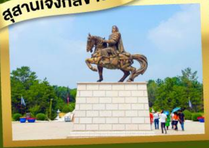
เนินทรายสี่งชาวน