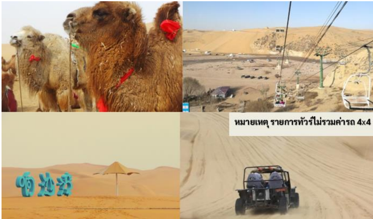
หมายเหตุ รายการทัวร์ไม่รวมค่ารถ 4x4

หมายเหตุ เพื่อความปลอดภัย ทางอุทยานสงวนสิทธิ์ไม่อนุญาตให้ท่านที่มีอายุ เกิน 60 ปี และท่านที่มีปัญหาเกี่ยวกับโรคกระดูกสันหลัง หรือมีอาการบาดเจ็บที่หลัง เข้าร่วมกิจกรรมนี้ได้ ทั้งนี้ เนื่องจากเป็นการชำระค่าตัวแบบเหมารวมบริษัทฯ จึงไม่สามารถคืนค่าใช้จ่ายในส่วนนี้ได้ และต้องขอภัยในความไม่สะดวกมา ณ ที่นี้ และหวังเป็นอย่างยิ่งว่าท่านจะเข้าใจในมาตรการเพื่อความปลอดภัยดังกล่าว