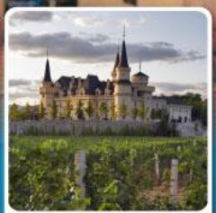
ไร่ไวน์ จุนยี่ เยินไก