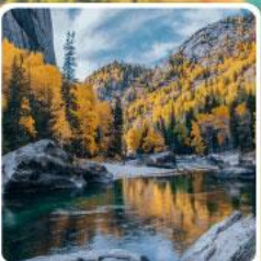
เคอเคอทัวไห่