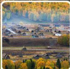
หมู่บ้านเหมอู่

สวรรค์ใบไม้เปลี่ยนสี เยือนคานาสีอแดนฝัน มหัศจรรย์หมู่บ้านเหมอู่ เคอเคอทัวไห่อัศจรรย์ภูผาหิน