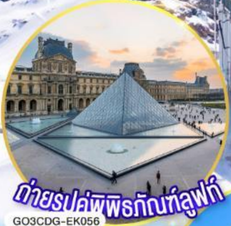
ถ่ายรูปพิพิธภัณฑ์ลูฟร์ GO3CDG-EK056