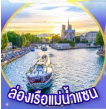
ล่องเรือแม่น้ำเซน