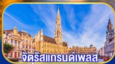
จัตุรัสแกรนด์เพลส