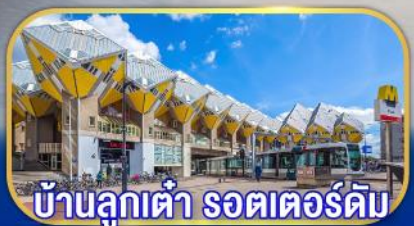
บ้านลูกเต่า รถเตอร์ดัม

เยือนเมืองเก่าแก่ยุโรป เก็บไฮไลต์กลุ่มประเทศเบเนลักซ์ กับการบินไทย บินตรงอัมสเตอร์ดัม