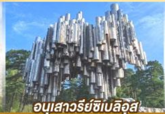
อนุสาวรีย์ซิลเบิลูส