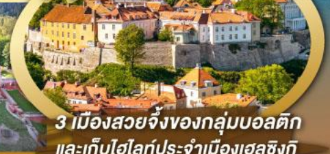
3 เมืองสวยจิ่งของกลุ่มบอลติก และเก็บไฮไลท์ประจำเมืองเฮลซิงกิ และล่องเรือเฟอร์รี่ข้ามประเทศ