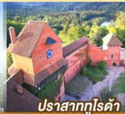
ปราสาทกูไรต้า