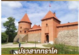
ปราสาททราโค