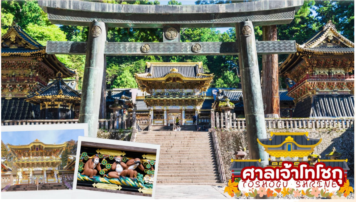
ศาลเจ้าโทโชกุ TOSHOGU SHRINE

นำท่านเดินทางสู่ นิโก้ (Nikko) เมืองมรดกโลกที่เต็มไปด้วยเอกลักษณ์ของญี่ปุ่น มีความสำคัญทางประวัติศาสตร์ยาวนานกว่า 1,200 ปี เป็นที่ตั้งของสุสานของโชกุนโทกุงะวะ อิเอะยะซุ กับโทกุงะวะ อิเอะมิตสึ โดดเด่นทั้งด้านทิวทัศน์ สถาปัตยกรรม