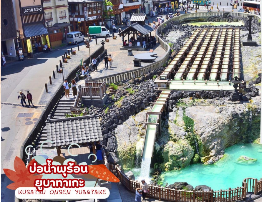
บ่อน้ำพุร้อน ยูกาตะกะ KUSATSU ONSEN YUBATAKE