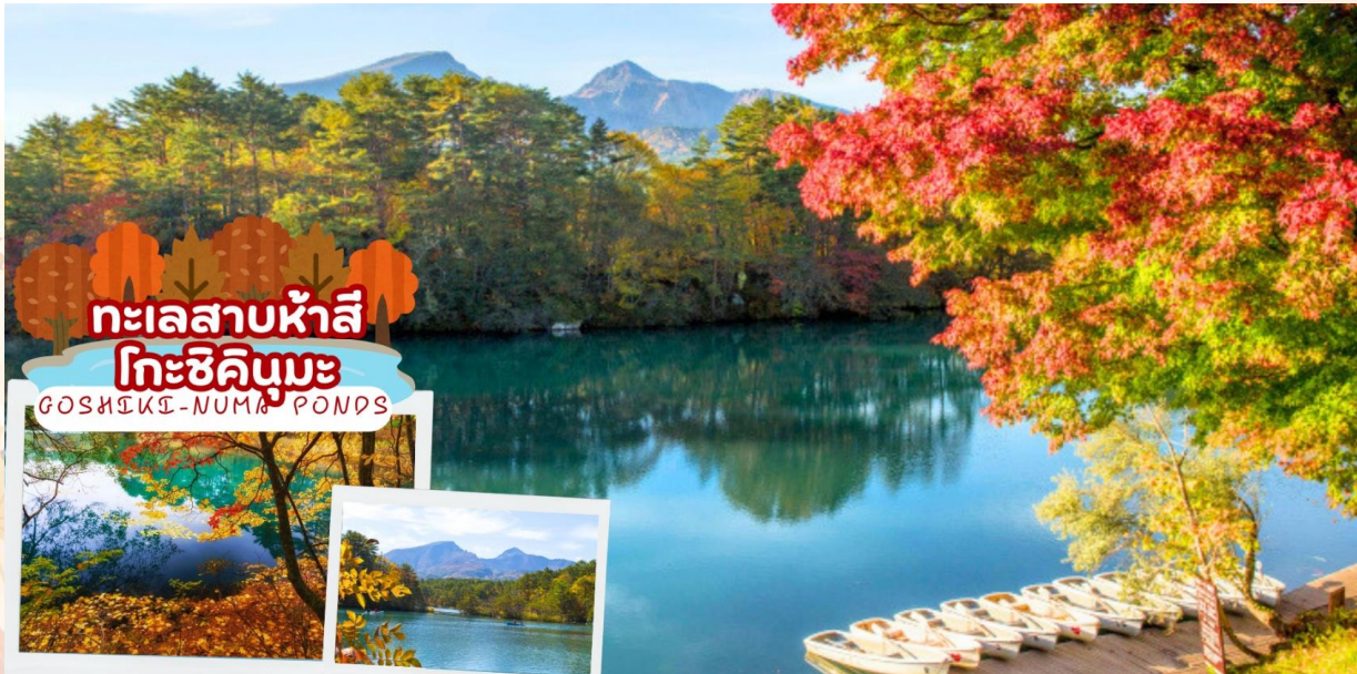
GO2NRT-TG101- UNSEEN NIIGATA FUKUSHIMA TOKYO AUTUMN 6D 4N

เดินทางสู่ เมืองไอส์ิวากามัตสึ (Aizu-Wakamatsu) เป็นเมืองในจังหวัดฟุคุชิมะที่ตั้งอยู่ก่อนไปทางตอนเหนือของญี่ปุ่นในภูมิภาคโทโฮกุ มีประชากรราว ๆ 125,000 คน ห้อมล้อมด้วยธรรมชาติอันอุดมสมบูรณ์ของภูเขาบันไดและทะเลสาบอินาวาชิโระ จึงจัดเป็นสถานที่เดินเขาและเล่นสกีที่ได้รับความนิยมจากนักท่องเที่ยวชาวยุโรปและในขณะเดียวกันก็เป็นเมืองที่โดดเด่นด้วยเสน่ห์ของประวัติศาสตร์ยุคซามูไรตั้งแต่สมัยที่ยังเป็นแคว้นไอส์ิวากามัตสึ จึงเหมาะกับนักท่องเที่ยวที่สนใจประวัติศาสตร์และวัฒนธรรมญี่ปุ่นด้วยเช่นกัน