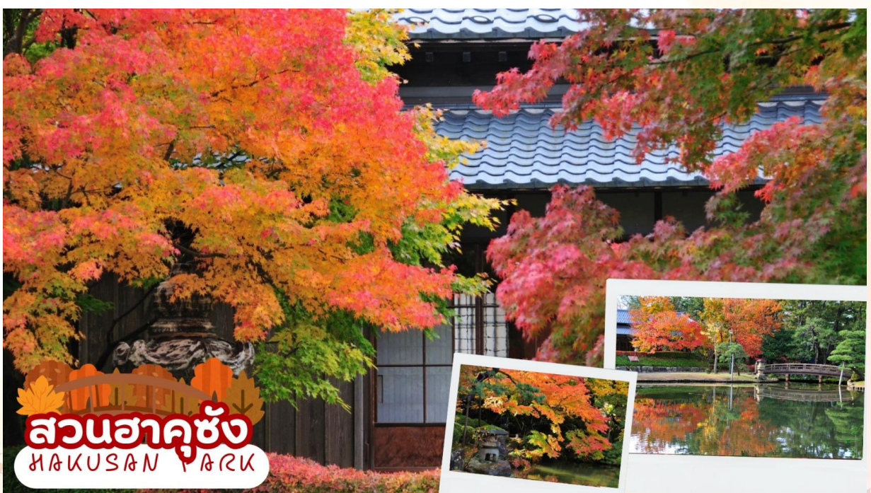
สวนฮาคุซัง HAKUSAN PARK

สวนฮาคุซัง (Hakusan Park) เป็นสวนสาธารณะประจำเมืองนิงะตะ ที่ออกแบบโดยได้รับแรงบันดาลใจจากชาวดัตช์ ตั้งอยู่ติดกับ ศาลเจ้าฮาคุซัง (Hakusan Shrine) และได้รับการยอมรับว่าเป็นหนึ่งในสวนสาธารณะในเมือง 100 อันดับแรกของญี่ปุ่น สวนมีความงามตามฤดูกาลที่หลากหลาย เช่น ดอกซากุระในฤดูใบไม้ผลิ ดอกบัวในฤดูร้อน ใบไม้เปลี่ยนสีในฤดูใบไม้ร่วง และหิมะในฤดูหนาว (ใบไม้เปลี่ยนสีขึ้นอยู่กับสภาพอากาศ)