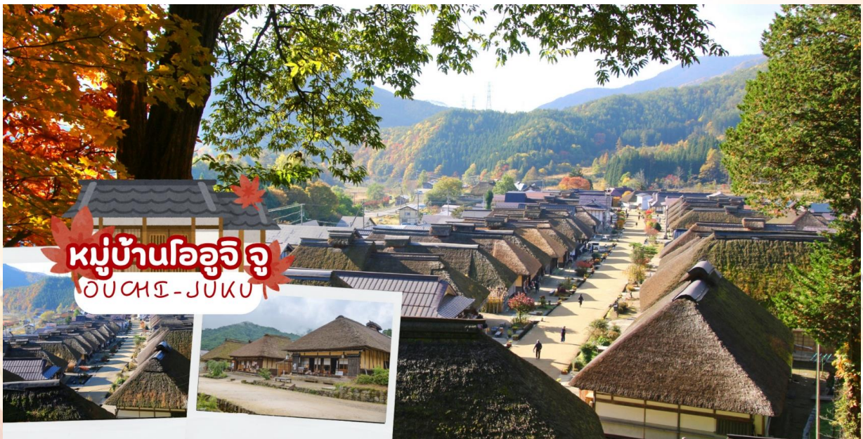
GO2NRT-TG101- UNSEEN NIIGATA FUKUSHIMA TOKYO AUTUMN 6D 4N

ชม หมู่บ้านโออุจิ จุกุ (Ouchi-Juku) เป็นบ้านสไตล์ญี่ปุ่นแบบมุงหลัง ถูกสร้างขึ้นในปี พ.ศ. 2183 เป็นบ้านพักในสมัยเอโดะที่ตั้งอยู่ในถนนสายสำคัญ ที่ใช้เชื่อมระหว่างเมืองไอสุวาคามัสสึกับเมืองนิกโก้ ซึ่งปัจจุบันดัดแปลงเป็นร้านค้า ร้านอาหารที่มีของท้องถิ่นขึ้นชื่อ “โซบะต้นหอม” ที่ชาวญี่ปุ่นนิยมรับประทาน นอกจากนี้ยังมีศาลเจ้าและวัดประจำเมืองโออุจิจุกุ โดยวัดตั้งอยู่ปลายสุดของถนนสายหลักให้นักท่องเที่ยวจะได้ชมทิวทัศน์อันงดงามของเมืองได้จากบริเวณด้านบนของวัด