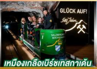
เหมืองเกลือบิรชเทสกาเดิน