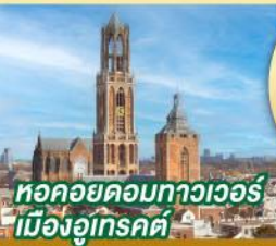
หอคอยดอกทาวเวอร์ เมืองอูเทรคต์