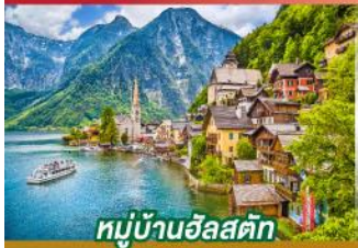
หมู่บ้านอัลสติก