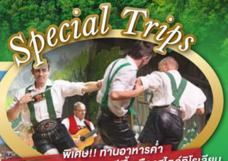
พิเศษ!! ทานอาหารค่ำ พร้อมชมการแสดงดนตรีพื้นเมืองสไตล์โรเลียน และเยือนเมืองอูเทรคต์ สีสันไม่เหมือนเนเธอร์แลนด์