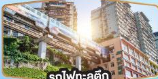
รถไฟฟ้า-ลูตึก