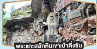
พระแกะสลักหินเขาเป่าต้งซัน