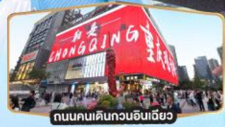
ถนนคนเดินทงยวนเฉียว