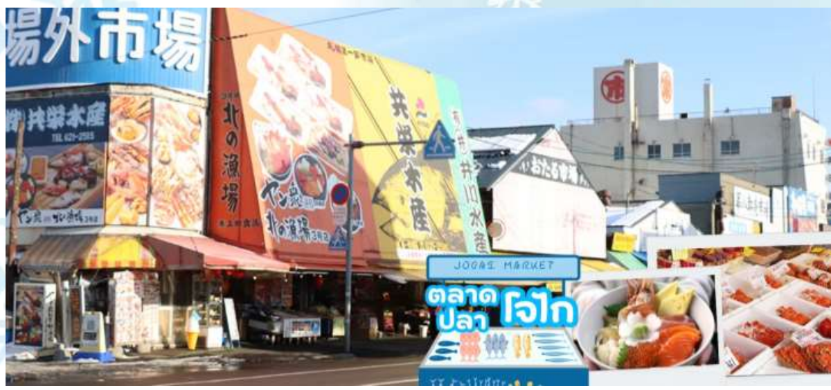
กลางวัน รับประทานอาหารกลางวัน ณ ร้านอาหาร (มื้อที่ 9) ข้าวหน้าปลาดิบ