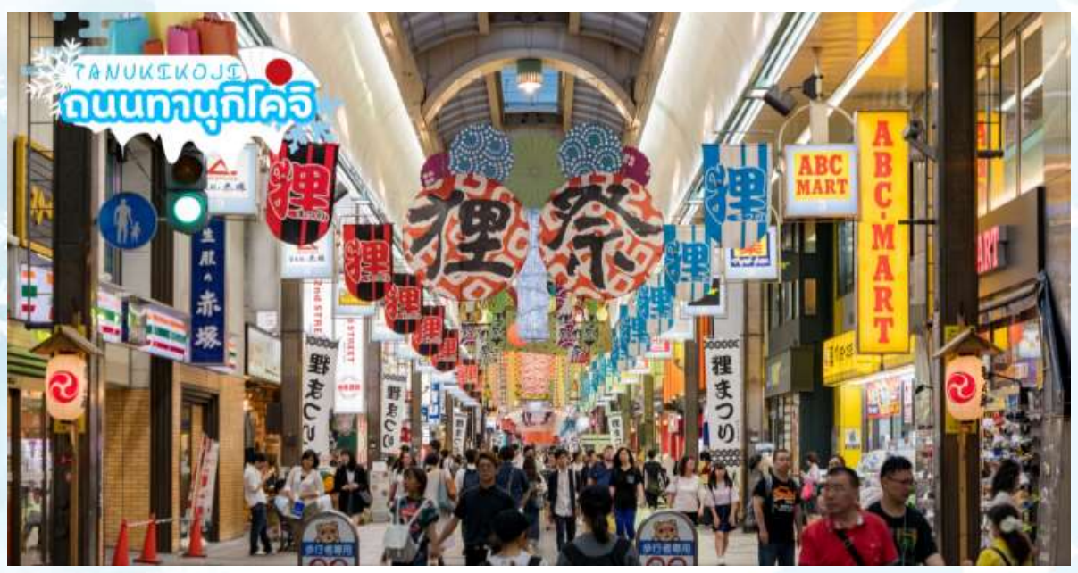
GO2CTS-TG081 -- -HOKKAIDO TOMAMU BIBAI SNOW LAND NEW YEAR 2027 6D 4N BY TG

ช้อปปิ้ง ถนนทานุกิโคจิ (Tanukikoji) เป็นย่านช้อปปิ้งเก่าแก่ ที่เปิดให้บริการยาวนานกว่า 100 ปี จุดเด่นของย่านนี้คือการสร้างหลังคาที่คลุมทั่วตลาด ไม่ว่าจะฝนตก แดดออก พายุหิมะ เข้าก็สามารถมาเดินช้อปปิ้งได้อย่างสบายใจ นอกจากนี้ยังมีร้านค้ามากถึง 200 ร้าน โดยมีความยาวประมาณ 1 กิโลเมตรส่วนสินค้าก็มีทั้งเสื้อผ้าและรองเท้าแบรนด์ ดังอย่าง Uniqlo, New Balance, Adidas, Puma เป็นต้น และที่จะพลาดไม่ได้เลยก็คือร้าน Daiso ที่ทุกอย่างราคา 100 เยน รวมไปถึงร้าน Donki ที่มีขายทุกอย่างตั้งแต่เครื่องใช้ไฟฟ้าไปถึงเครื่องสำอางค์ในราคาที่ถูกจนน่าตกใจหรือถ้าเดินจนหมดแรงที่นี่ก็มีร้านอาหารดังๆหลายร้านคอยให้บริการอยู่ด้วย