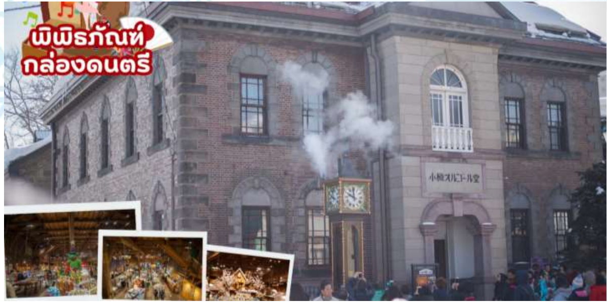
พิพิธภัณฑ์กล่องดนตรี พิพิธภัณฑ์กล่องดนตรีโอตารุเป็นหนึ่งในร้านค้าที่ใหญ่ที่สุดของพิพิธภัณฑ์กล่องดนตรีในญี่ปุ่น โดยตัวอาคารมีความเก่าแก่สวยงาม และถือเป็นสถานที่สำคัญทางประวัติศาสตร์

เช้า รับประทานอาหารเช้า ณ ห้องอาหารของโรงแรม (มื้อที่ 5)