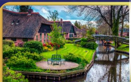
ล่องเรือหมู่บ้านโรกนทึร์รูน