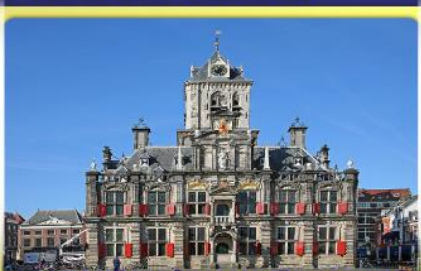
อาคารเมืองเก่าคลองเมืองเคลฟท์