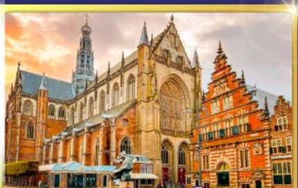
จัตุรัสเมืองฮาร์เล็ม

พรมแดนเมืองแปลกเนเธอร์แลนด์และเบลเยียม เดินเมืองเคลฟท์ เมืองเครื่องปั้นดินเผาระดับโลก ฮาร์เล็มเมืองมั่งคั่งที่สุดของเนเธอร์แลนด์