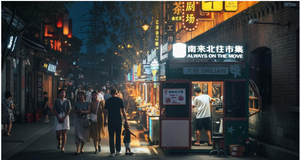
คำ อิสระอาหารเย็น ณ ต้าเหลียนไนท์มาร์เก็ต จากนั้นนำท่านเดินทางเข้าสู่ที่พัก

นำท่านแวะอิสระแวะชิมแวะทานอาหาร ณ ต้าเหลียนไนท์มาร์เก็ต ในตรอกและลานกว้างที่สว่างด้วยป้ายไฟสีจัด เสียงพ่อค้าเรียกลูกค้าสลับกับเสียงมีดกระทบเขียงและน้ำมันเดือดในกระทะ ฉากชีวิตยามค่ำที่สะท้อนจังหวะของเมืองท่าซึ่งคึกคักมาตั้งแต่อดีต เห็นครอบครัวแวะซื้อของกินกลับบ้าน นักศึกษาอินล่อมโต๊ะเล็ก ๆ เพื่อแบ่งกันชิมของทอด ริมทางมีทั้งของว่างสตรีทฟู้ด เครื่องดื่มหวานเย็น เสื้อผ้า ของใช้จิปาละ และของที่ระลึกเล็ก ๆ ที่สะท้อนรสนิยมแบบเมืองชายฝั่งทางเหนือของจีน บางคนมาเพื่อหาอะไรอุ่นท้อง หลังเลิกงาน บางคนมาเดินดูผู้คนมากกว่าดูสินค้า และนั่นแหละคือเสน่ห์ของที่นี่