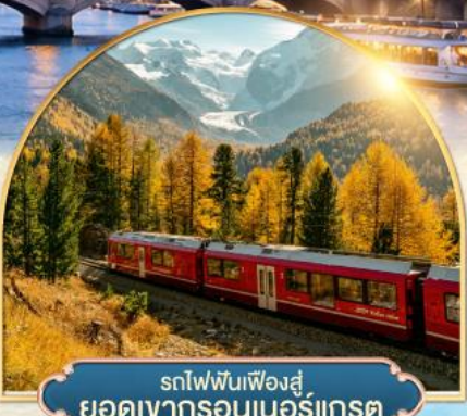
รถไฟฟันเฟืองสู่ยอดเขากรอนเนอร์แกรต