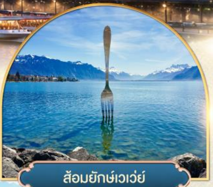
ส้อมยักษ์เวอว์ย