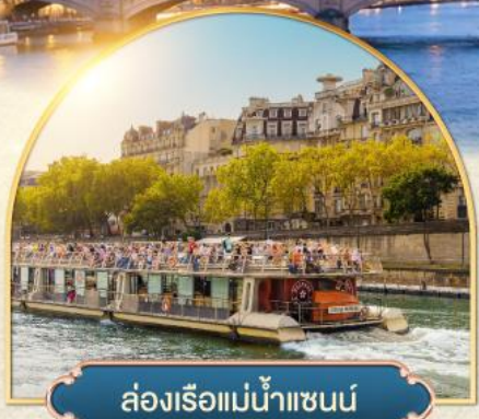
ล่องเรือแม่น้ำแซนน์