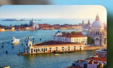
ชมความงามเมืองเวนิส