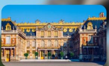
เข้าชมพระราชวังแวร์ซาย