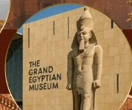
พิพิธภัณฑ์แกรนด์อียิปต์