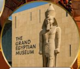
พิพิธภัณฑ์แกรนด์อียิปต์