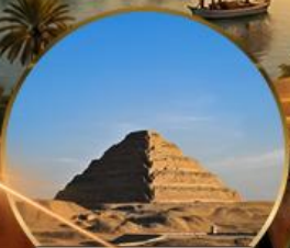
พีระมิดขั้นบันได