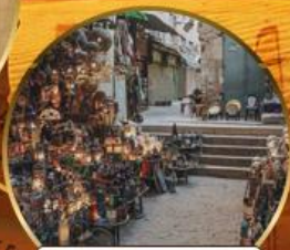
ตลาดบ้านเอลคาลิสิ