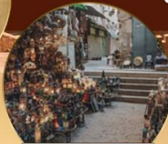
ตลาดย่านเอลคาลิฟี