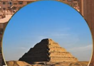
พีระมิดขั้นบันได