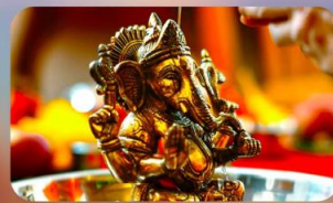
ร่วมพิธี Abhishekam