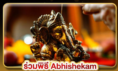
ร่วมพิธี Abhishekam