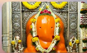
องค์อิชฏิวินายัก