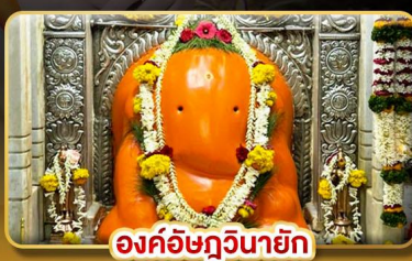
องค์อชฏวินายัก