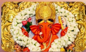
องค์สิทธิวินายัก