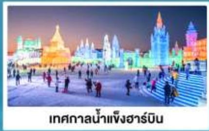
เทศกาลน้ำแข็งฮาร์บิน