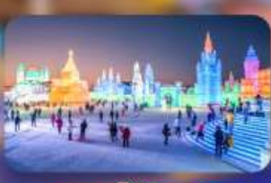
เทศกาลน้ำแข็งฮาร์บิน