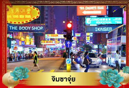
จิมซาจุย