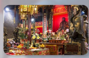
วัดปึกโท่