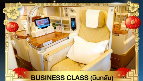
BUSINESS CLASS (บินกลับ)

น้ำหนักกระเป๋า ขาไป 30Kg. | ขากลับ 40Kg.