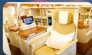
BUSINESS CLASS "บินกลับ"