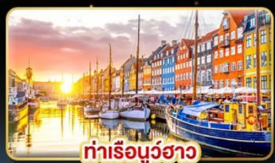
ท่าเรือบูฮาว