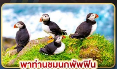
พาท่านชมนกพิภพฟิน