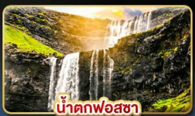
น้ำตกฟอสซา