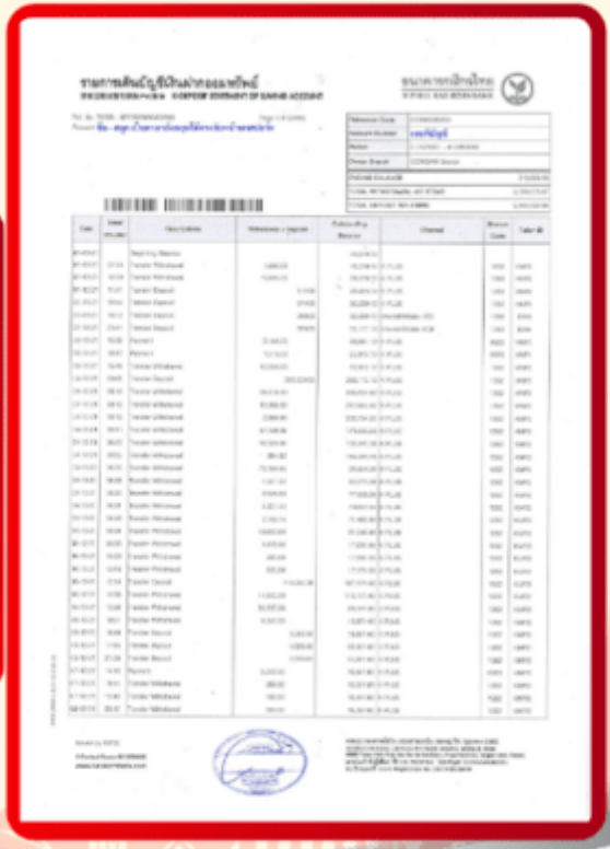
ตัวอย่าง Bank Statement ที่ผู้สมัครต้องขอจากธนาคาร

3.4 ปรับสมุดบัญชีธนาคารตัวจริง และเตรียมไปในวันที่ยื่นวีซ่า