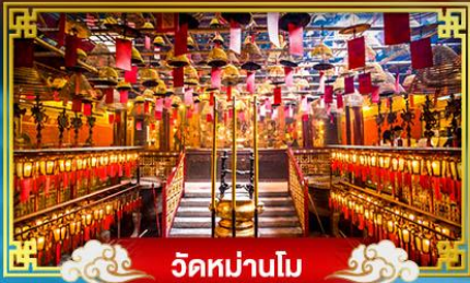
วัดท่าม่านโม