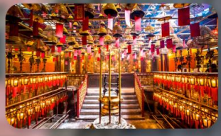
วัดหม่านโม