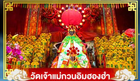
วัดเจ้าแม่กวนอิมสองอำ

HONG KONG TOURISM BOARD แจกฟรี! ปีเซี่ย-ฮ่องกง