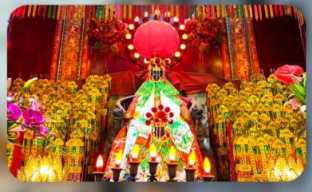
วัดเจ้าแม่กวนอิมสองฮา