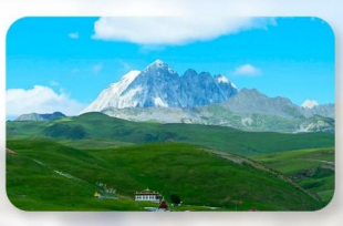
ทุ่งหญ้าท่ากวง