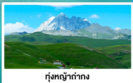
ทุ่งหญ้าด่าง